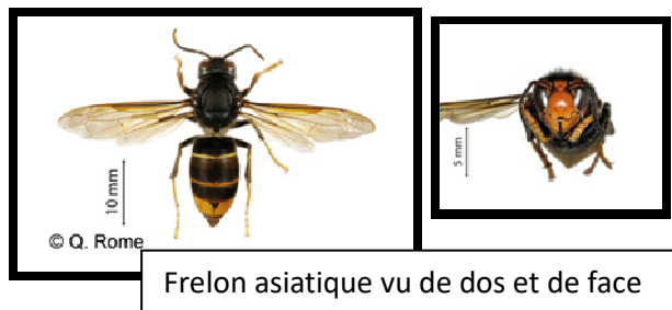
Frelon asiatique vu de dos et de face

Arrivé accidentellement en France en 2004, le Frelon asiatique s'est acclimaté en France et s'est fortement développé en nourrissant ses larves des insectes et notamment des abeilles. Cette espèce représente aujourd'hui une menace pour la biodiversité et pour l'apiculture, et a été classée « espèce exotique envahissante et nuisible ». La destruction des colonies reste la méthode la plus efficace pour diminuer les populations de Frelon asiatique.